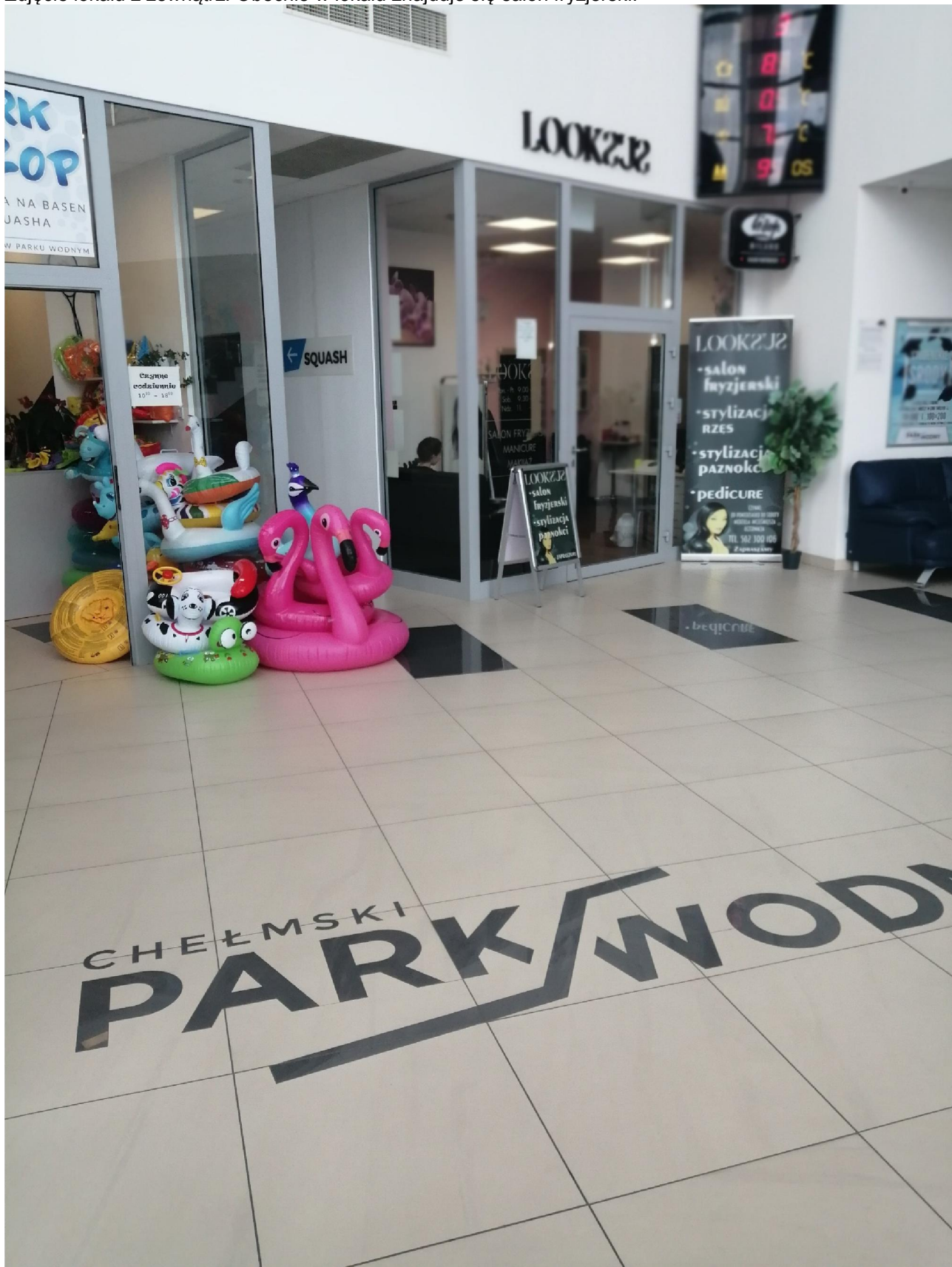
Zdjęcie lokalu z zewnątrz. Obecnie w lokalu znajduje się salon fryzjerski.