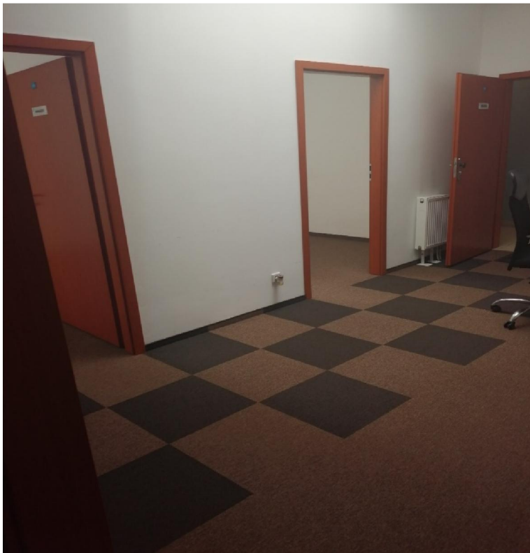
Zdjęcie nr 3 – korytarz – pomieszczenie nr 7