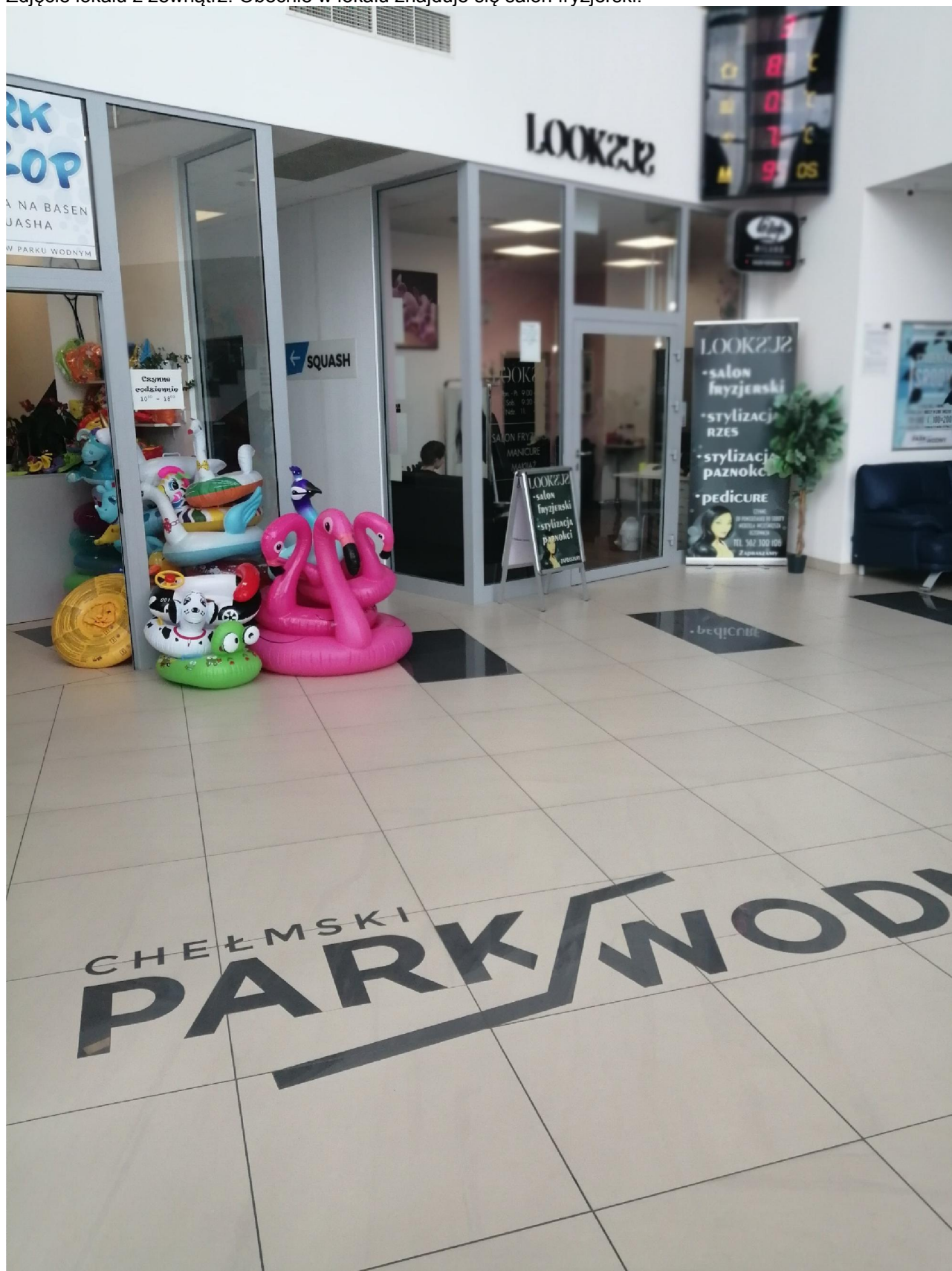
Zdjęcie lokalu z zewnątrz. Obecnie w lokalu znajduje się salon fryzjerski.