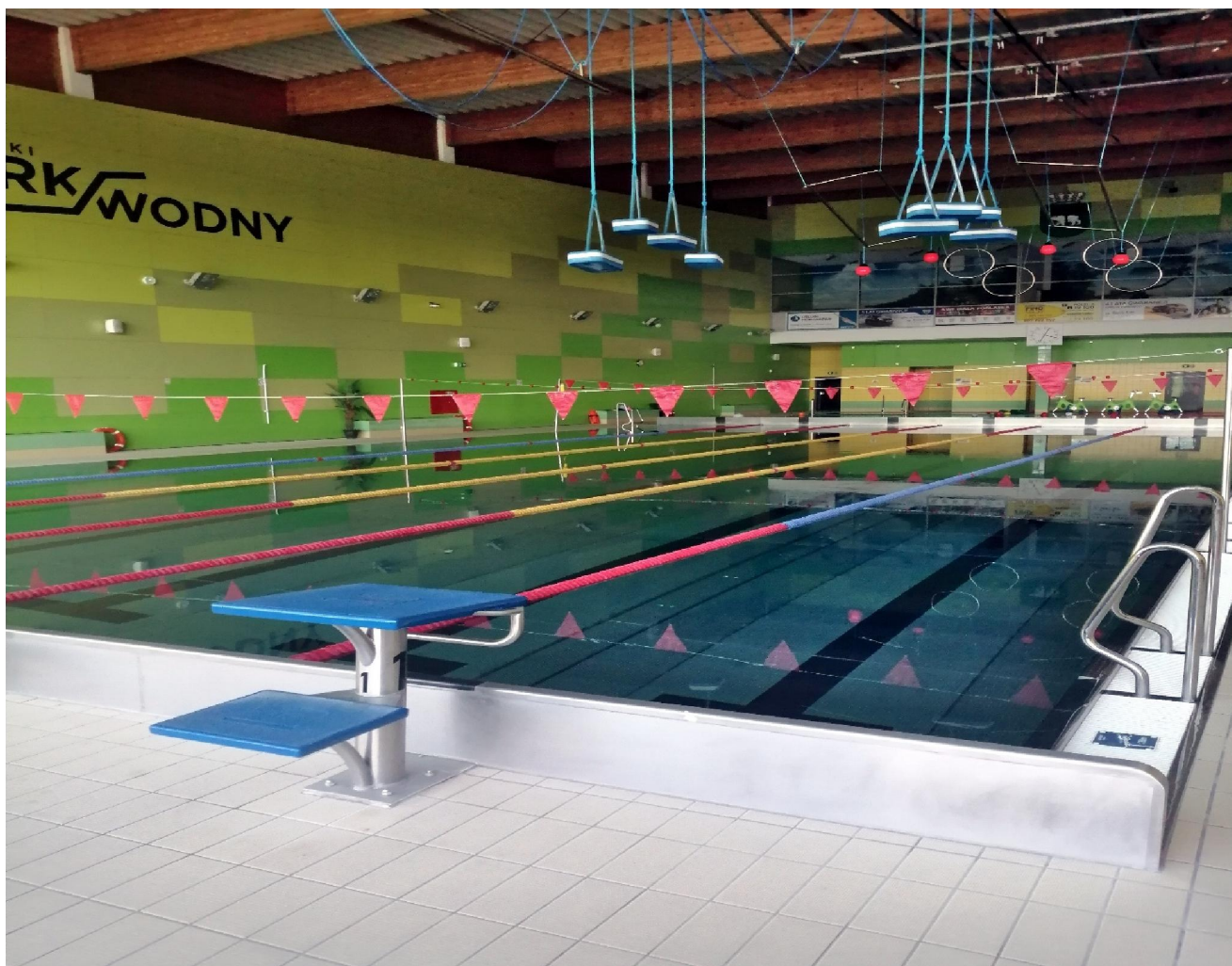
Fot.3. Widok basenu sportowego z podwieszonym do sufitu wodnym torem przeszkód