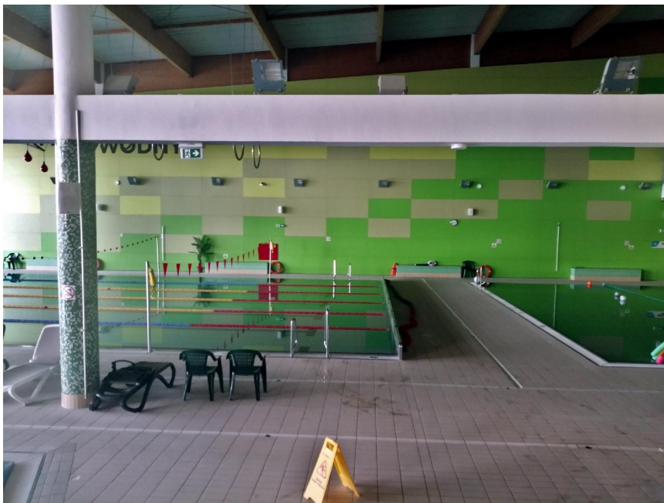
Fot.4. Widok basenu do nauki pływania