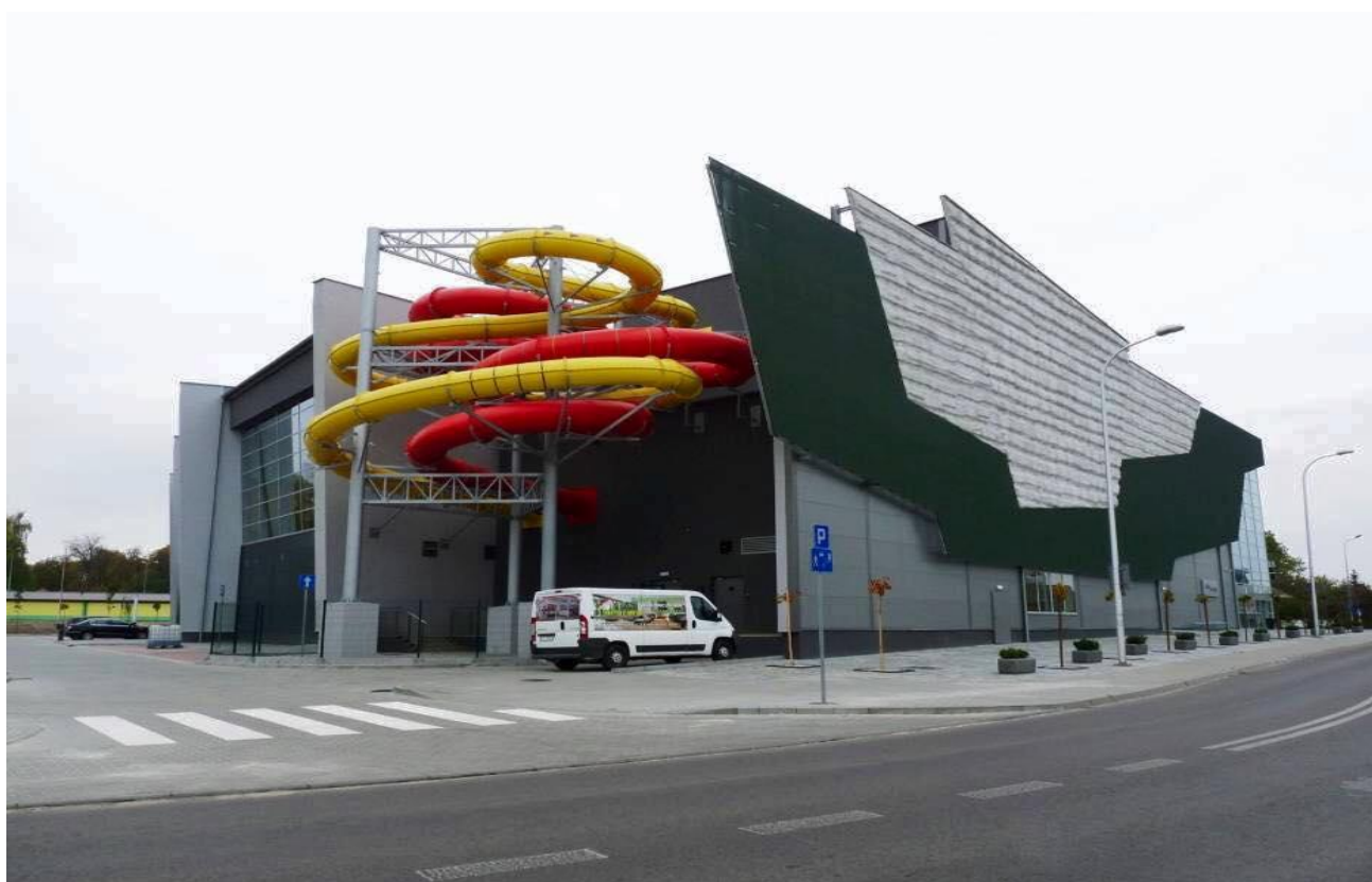
Fot.2. Chełmski Park Wodny od strony ul. Trubakowskiej.

Obiekt przeznaczony jest dla użytkowników w różnym wieku od niemowląt po osoby w wieku emerytalnym oraz jest w pełni dostępny dla osób niepełnosprawnych w zakresie stref ogólnodostępnych.