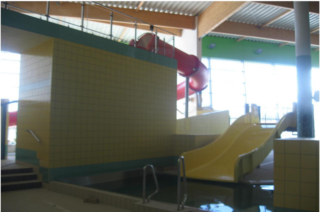
Fot.7. Widok zjeżdżalni wewnętrznych - zjeżdżalnia rodzinna i część zjeżdżalni rurowej

Długość ślizgu – 6,00 m. Start z poziomu – 6,20 m. Różnica poziomów – 1,70 m. Nachylenie – 28,33 %. Przepływ wody – 120 m 3 / h.