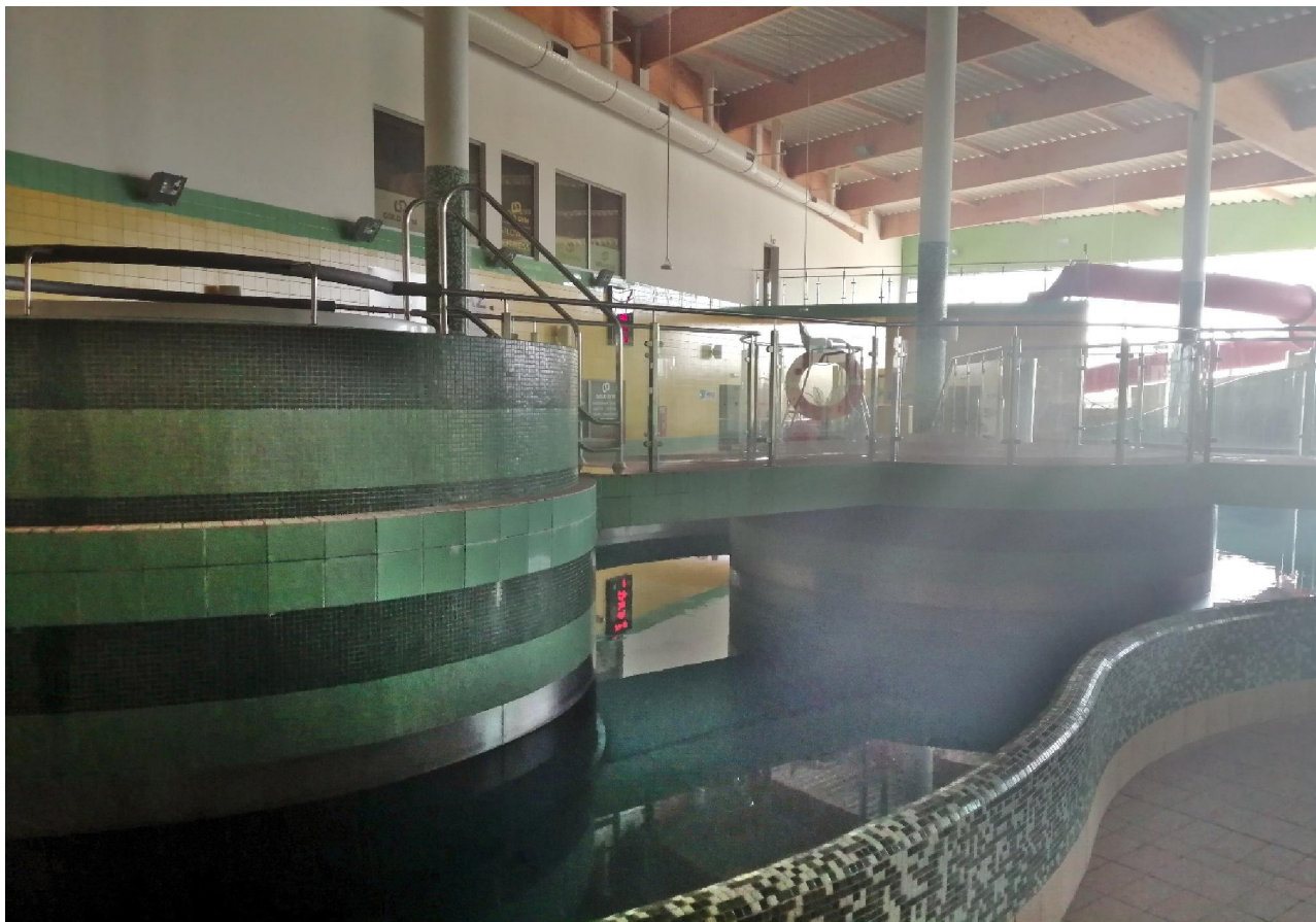
Fot. 13 Rwąca rzeka.