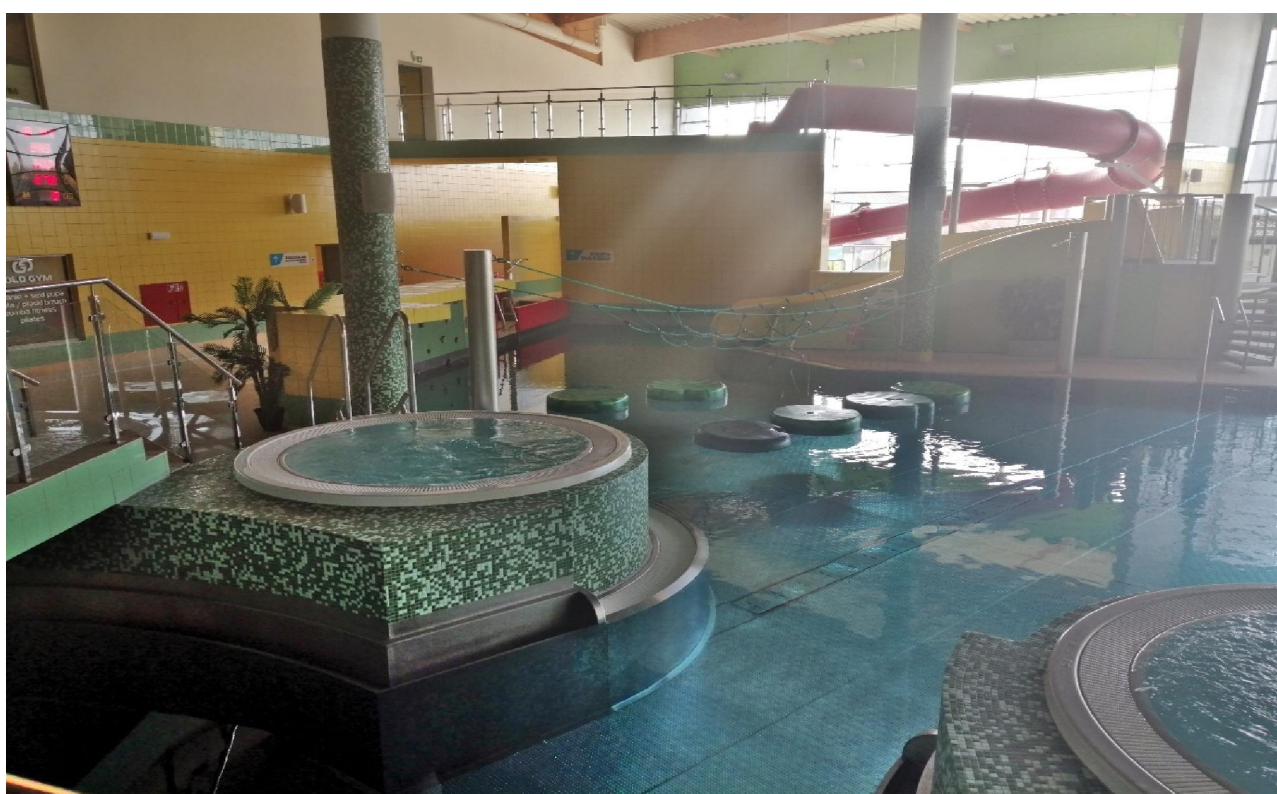
Fot.5. Widok części basenu rekreacyjnego.

Basen rekreacyjny został wyposażony w następujący program atrakcji: