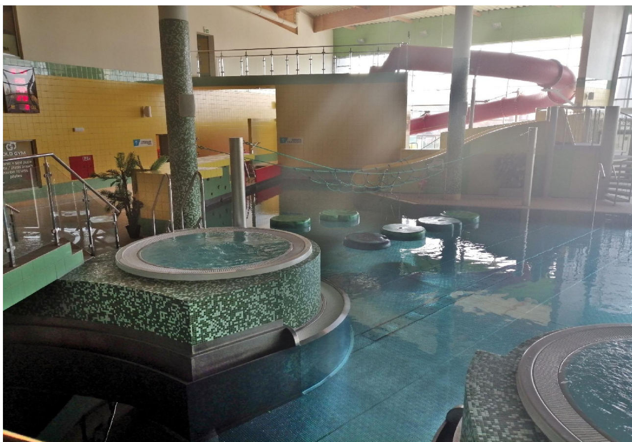
Fot.12. Widok na wanny z hydromasażem.