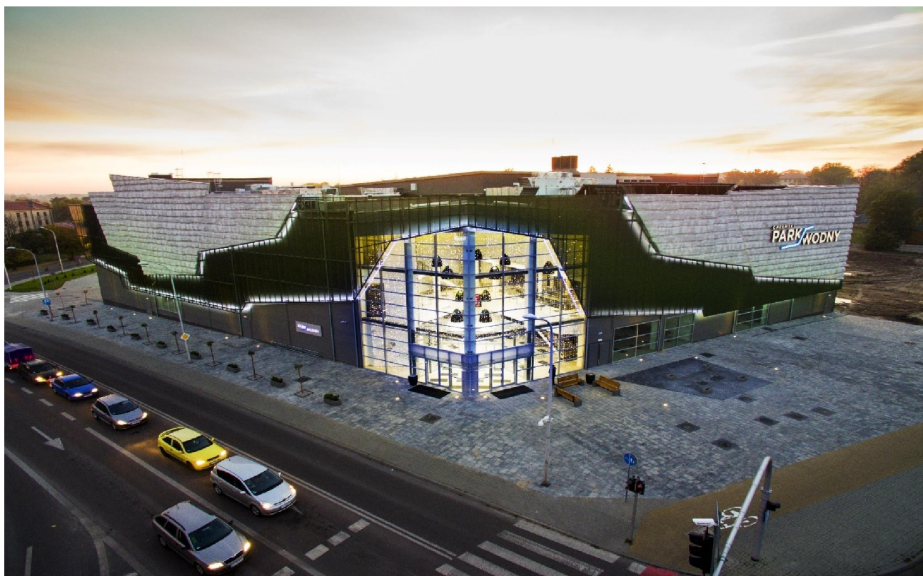
Fot.1. Chełmski Park Wodny od strony ul. Lubelskiej.