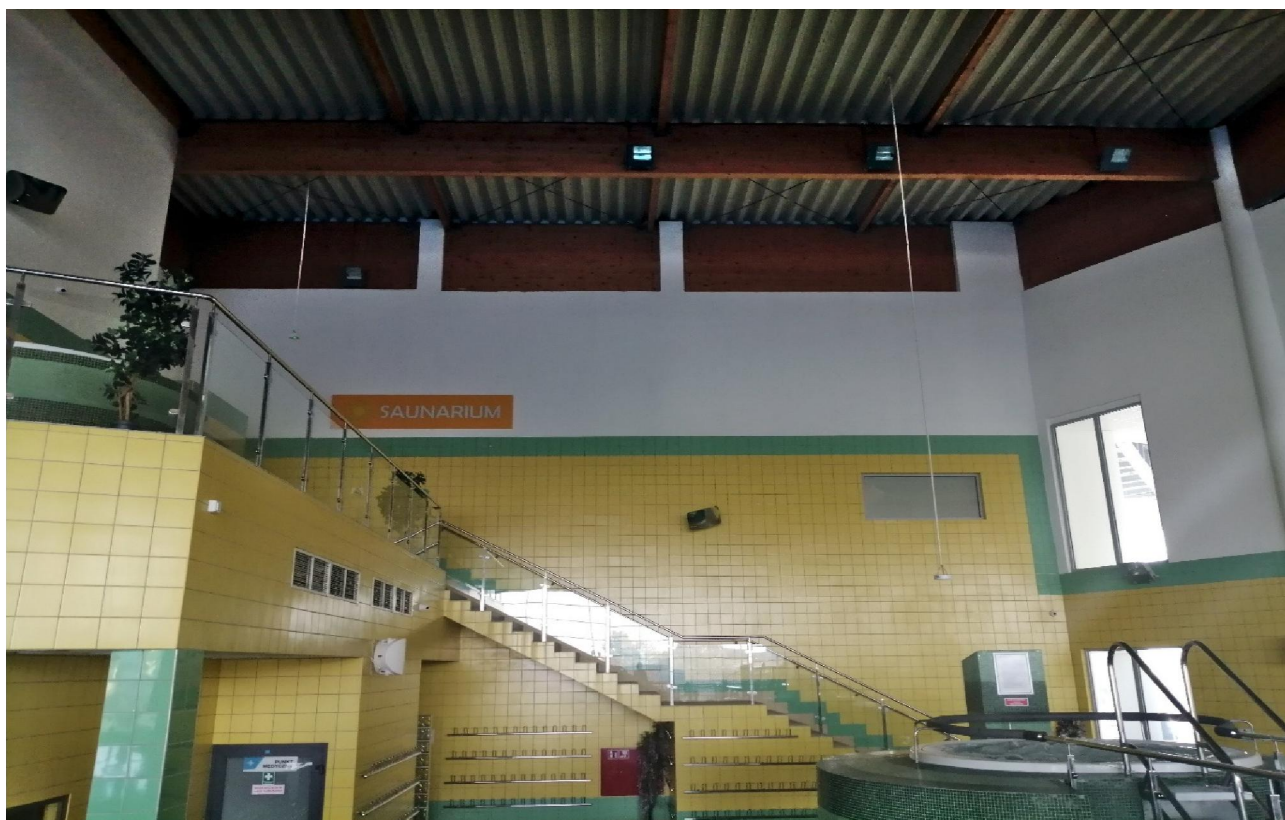
Fot.10. Widok na pomieszczenie dla ratowników, PPM oraz wannę z hydromasażem.