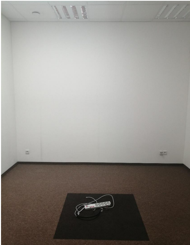
Zdjęcie nr 4 – pomieszczenie nr 1