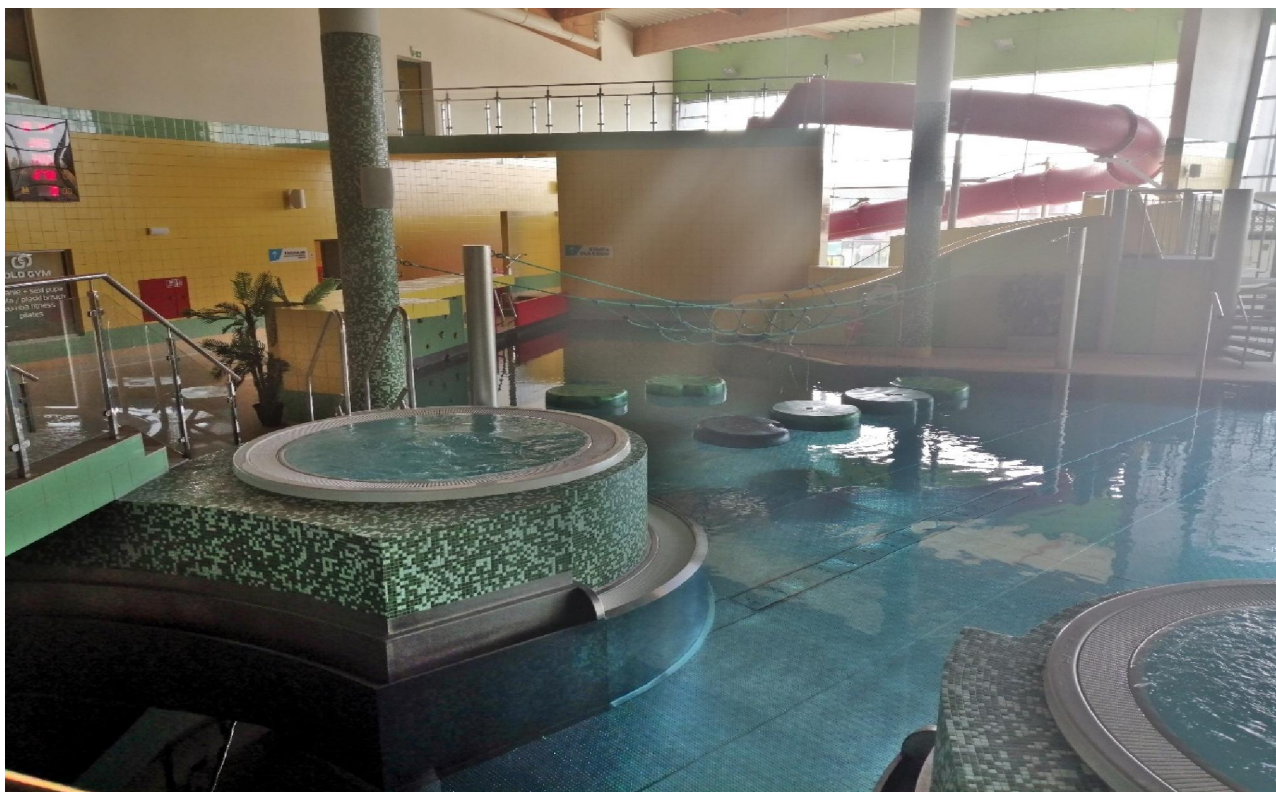
Fot.5. Widok części basenu rekreacyjnego.

Basen rekreacyjny został wyposażony w następujący program atrakcji: