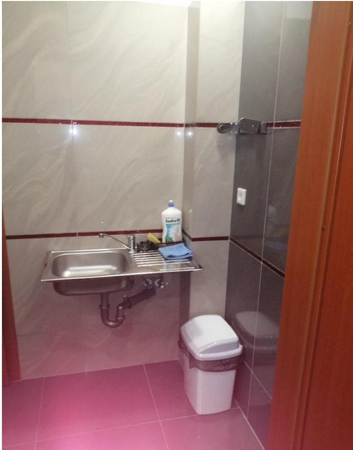
Zdjęcie nr 10 - pomieszczenie nr 6 + wc