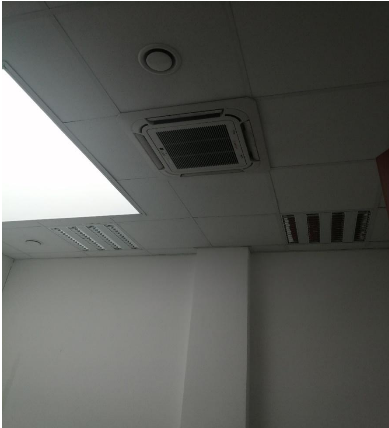
Zdjęcie nr 14 – klimakonwektor - pomieszczenie nr 2