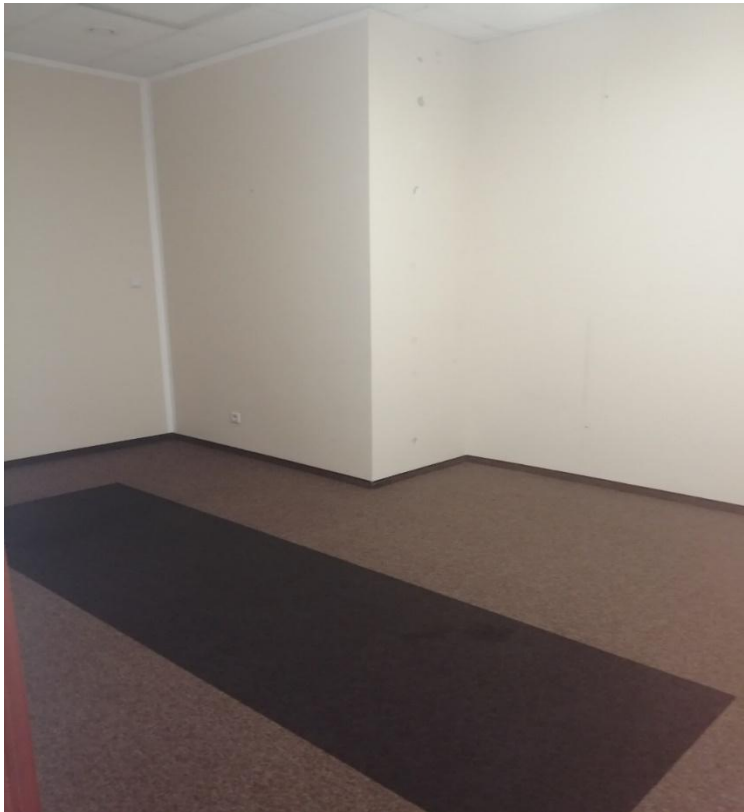
Zdjęcie nr 6 – pomieszczenie nr 3