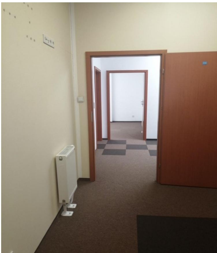
Zdjęcie nr 7 – Rzut z pomieszczenia nr 3