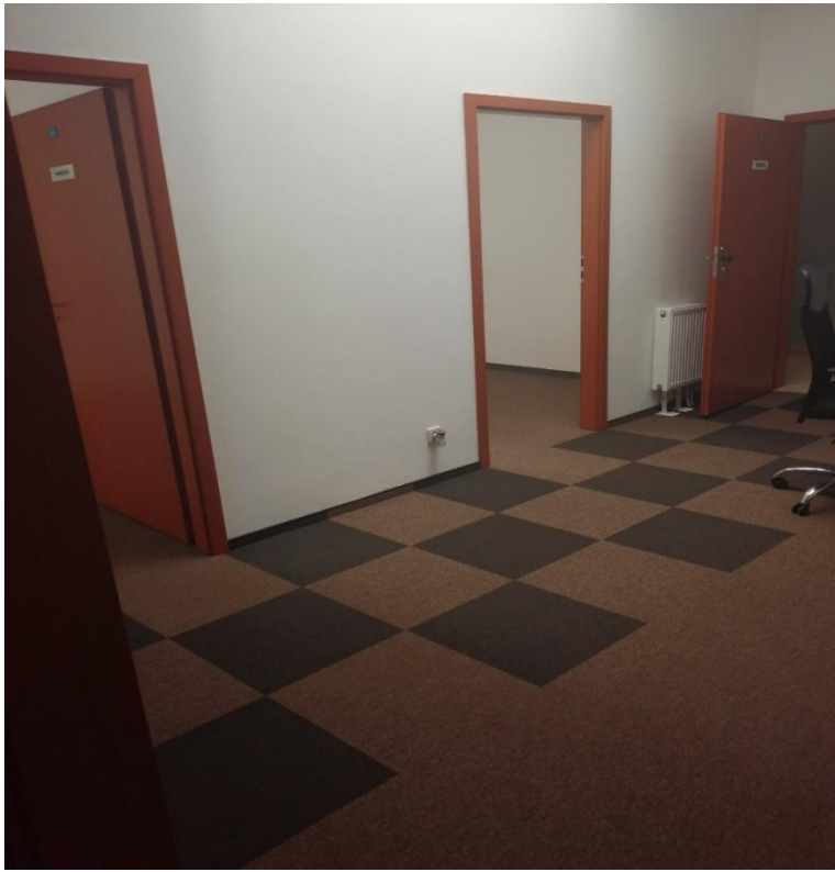
Zdjęcie nr 3 – korytarz – pomieszczenie nr 7