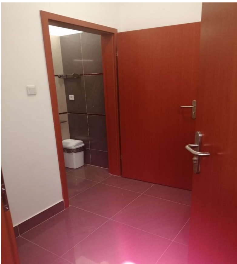
Zdjęcie nr 9 – pomieszczenie nr 5