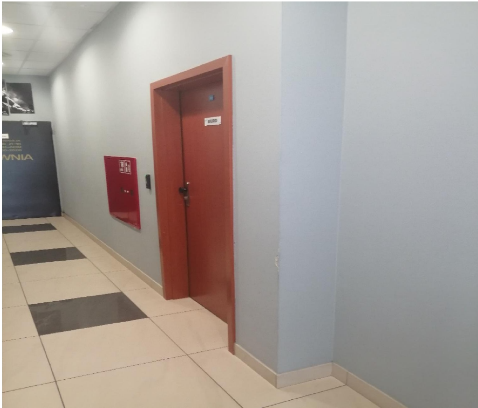
Zdjęcie nr 1 – wejście do lokalu