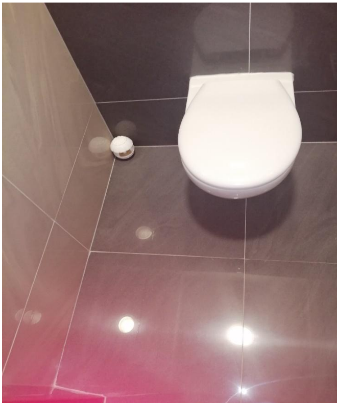
Zdjęcie nr 11 – pomieszczenie nr 6 – wc