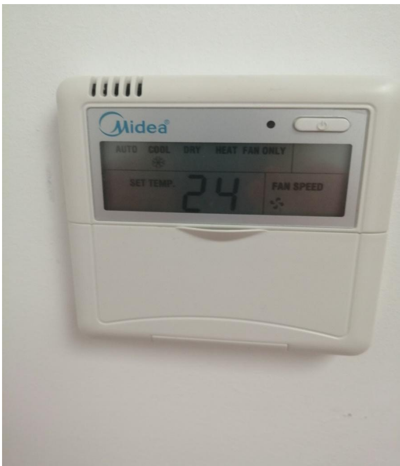
Zdjęcie nr 15 - panel obsługujący klimakonwektor – pomieszczenie nr 1, 2, 3