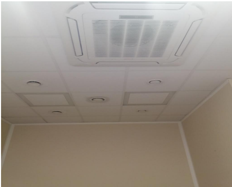
Zdjęcie nr 13 – klimakonwektor – pomieszczenie nr 3