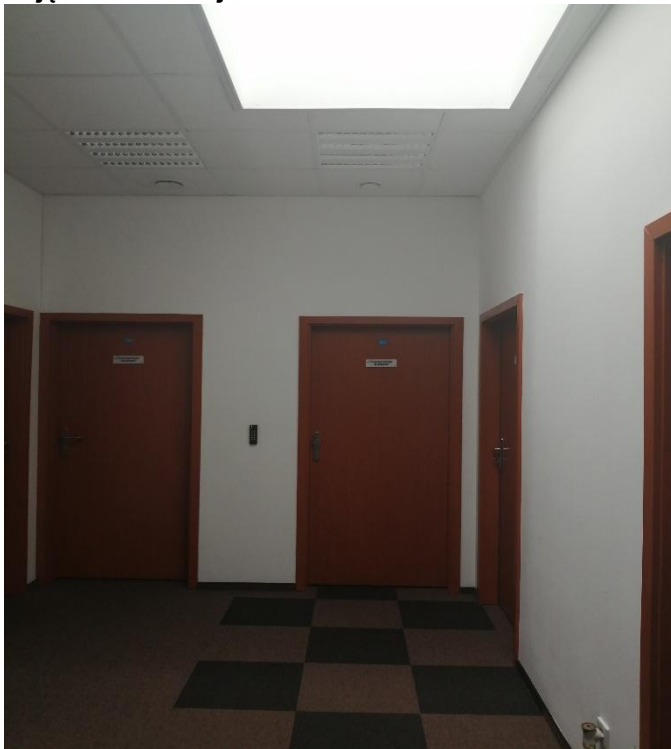
Zdjęcie nr 2 – korytarz – pomieszczenie nr 7