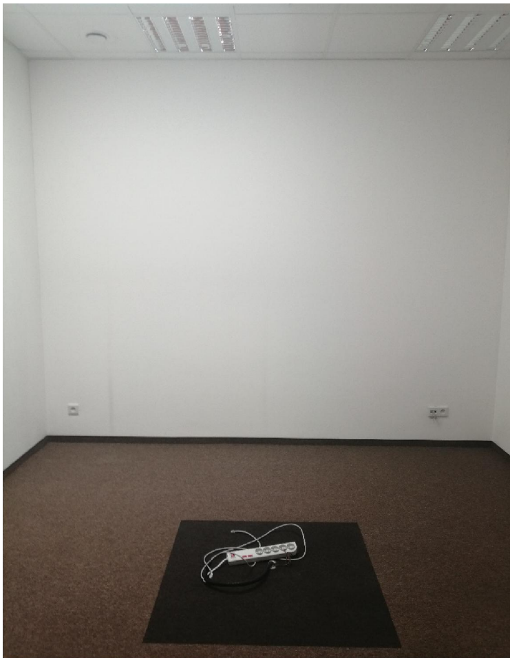
Zdjęcie nr 4 – pomieszczenie nr 1