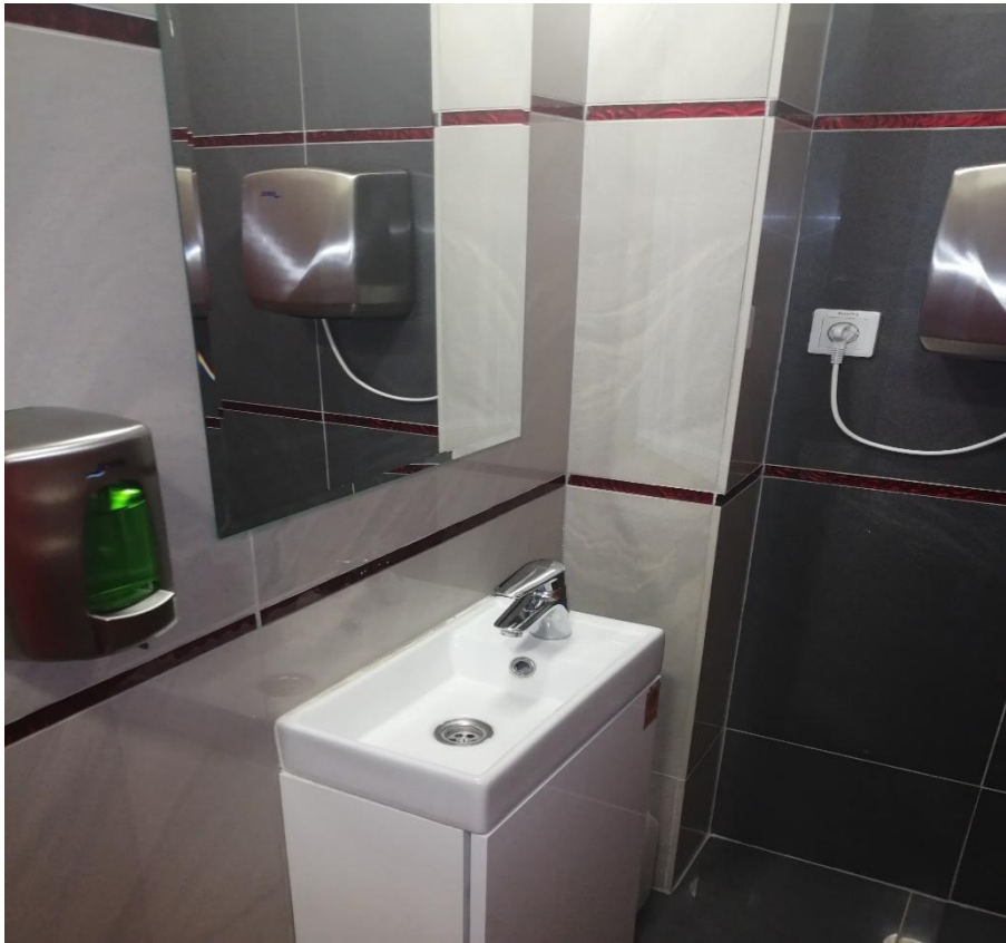
Zdjęcie nr 12 – pomieszczenie nr 6 – łazienka