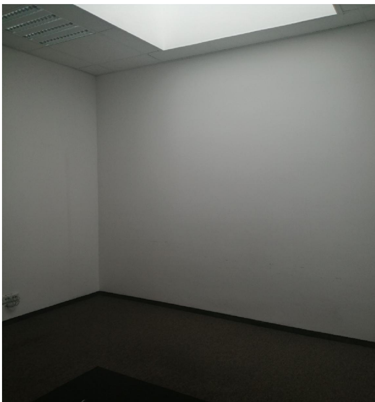
Zdjęcie nr 5 - pomieszczenie nr 2