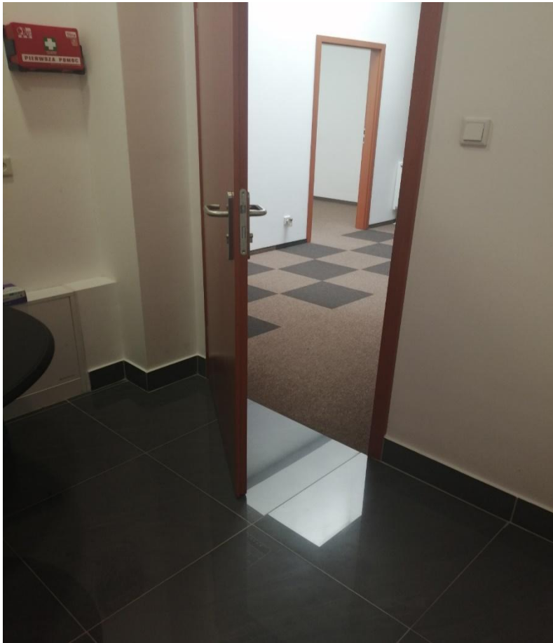
Zdjęcie nr 8 – pomieszczenie nr 5